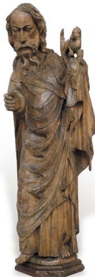
7. Cheb, Galerie výtvarného umění, Św. Jan Chrzciciel .