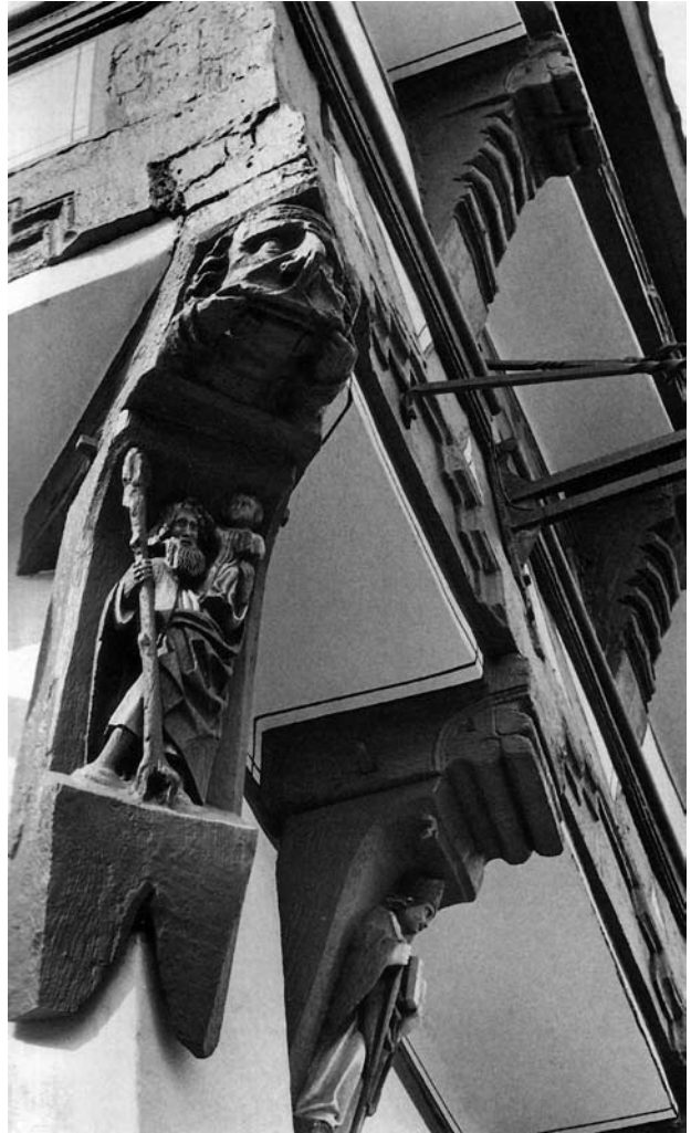
2. Brunzswik, Św. Krzysztof na elewacji domu przy Alte Knochenhauerstrasse 13 (Hotel Ritter Sankt Georg).

Domniemuję, że w czasie którejś przebudowy kamienicy, może w ostatnim trzydziestoleciu w. XVI, figurę przeniesiono z naroża na jej „wierzch”, co rozumieć trzeba jako attykę. W r. 1791 Św. Krzysztof został stamtąd zdjęty, jak informuje zacytowany przez Ambrożego Grabowskiego fragment dziennika Wojciecha Mączyńskiego. Zapewne wtedy rzeźba uległa uszkodzeniu, odbito jej dolną część. Spodnia krawędź figury ma wprowadzić pozór starannego opracowania ale trudno przyjąć, że jej oryginalne zakończenie biegło poprzez uda świętego. Jeśli ustawić figurę na dolnej krawędzi uderzy nas nienaturalne przekrzywienie, opadanie figury na lewą (od patrzącego) stronę a także diagonalna festonu fałdów po prawej, w miejsce zgodnej z prawem ciężenia wertykali. Ponadto sens, przesłanie, ideowa wymowa przedstawień Krzysztofa – wszystko to byłoby nieczytelne bez uwzględnienia kroczenia przez rzekę. Praktycznie brak w dawnej sztuce innych przedstawień tego świętego niż całopostaciowe. Zresztą Grabowski, za nim Józef Wawel-Louis i Adolf Sternschuss mówią o „statui znacznej wielkości” i „wysokiej postaci widział-