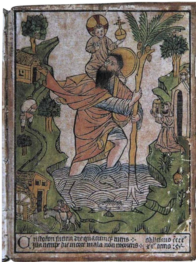
3. Manchester, John Ryland's Library, Św. Krzysztof, drzeworyt z klasztoru Buxheim nad Jez. Bodeńskim, 1423.

i obrazowych o św. Krzysztofie. Pierwotnie czczony był on tylko z racji okoliczności męczeństwa – mówi o tym przekaz literacki – Passio Sancti Christophori . Przełom polegający na zaakcentowaniu zgoła odmiennego epizodu z legendarnego żywota świętego dokonał się w krajach alpejskich, w XII wieku. Za najstarsze przechowane przedstawienie św. Krzysztofa przenoszącego Chrystusa przez rzekę uważa się malowidło ściennie na zamku Hocheppan (Castel d'Appiano) w Południowym Tyrolu.