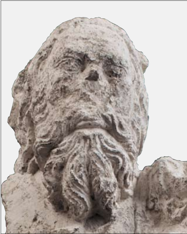
8. Św. Krzysztof, z Pałacu „pod Krzysztoforą” – głowa.

4. ćwierci w. XIV w Krakowie. Najlepsze artystycznie dokonanie tej epoki stanowi zespół zworników z parteru Kamienicy Hetmańskiej, który oglądać możemy in situ , w pomieszczeniach zajmowanych dziś przez reprezentacyjną śródmiejską księgarnię (Rynek Główny 17). Muzeum Narodowe posiada zresztą odlewy gipsowe tych zworników. Są one przygotowywane do eksponowania w nieodległej przyszłości.