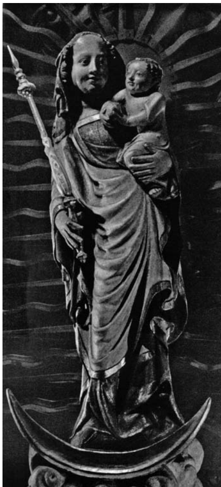
6. Broumov, kościół benedyktynów p. w. ŚŚ. Piotra i Pawła, Matka Boska z Dzieciątkiem .

nie jest już ażurową koronką narzuconą na przestrzeń – miejsce lekkich filarów wiązkowych zajmują filary na planie prostokąta, traktowane jako część muru. W opracowaniu detalu architektonicznego oschłe, linearne formy zostają wyparte przez formy plastyczne. Te w pewnym momencie zaczynają wręcz żyć własnym życiem: żebra odrywają się od kap sklepiennych i zbiegają się w podwieszonym pod sklepieniem zworniku (zakrystia katedry Św. Wita w Pradze). Słowem: architektura nabiera plastycznego wyrazu. Z kolei rzeźba dopasowuje się do monumentalnych ram architektonicznych. Staje się tektoniczna, o uproszczonym konturze i sumarycznej, skrótowej, dosłownie i w przenośni – lapidarnie potraktowanej formie. Ciało nabierają masywności a tkaniny okrywają je niby ciężka kurtyna pobrużdżona reliefem fałdów. Przy czym te poprzeczne, spokojnie przebiegające, przeważają nad abstrakcyjnymi wertykalami, pozostałościami idealizującego stylu I. połowy w. XIV.