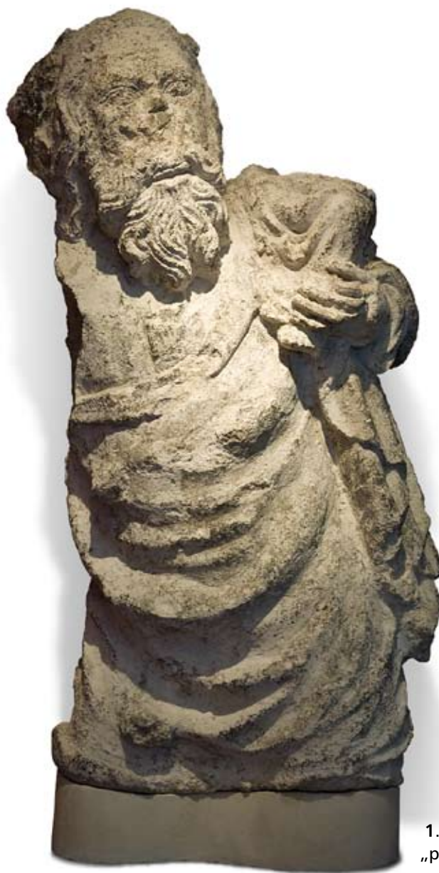
1. Św. Krzysztof, z Pałacu „pod Krzysztofory”.

wapień jurajski, 102 (z występnym w plecach: 120) × 60 × 30 cm, ślady polichromii – pozyskany przed r. 1929